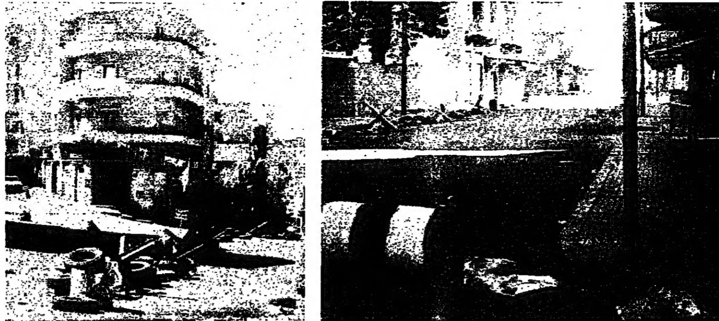
سلح وعواقب في شوارع طرابلس

محاولة جمع اللجنة الأمنية اليوم بوجود موفد سوري وحضور كرامي